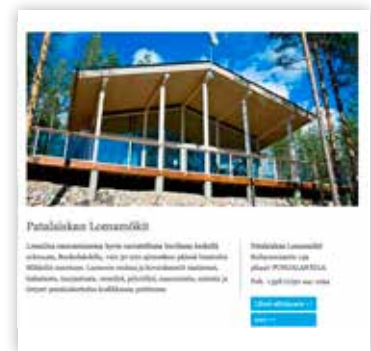
Kuva 1 Paketti 1, perustiedot netissä