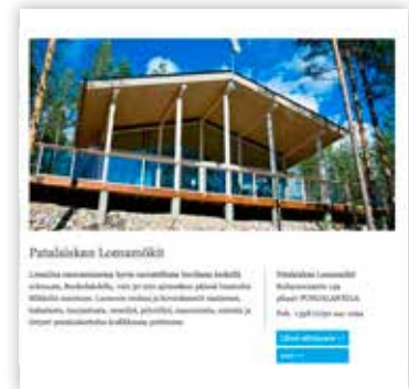
Kuva 1 Paketti 1, perustiedot netissä